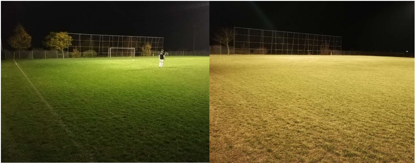
Blick von der Mittellinie – Nordseite nach Osten