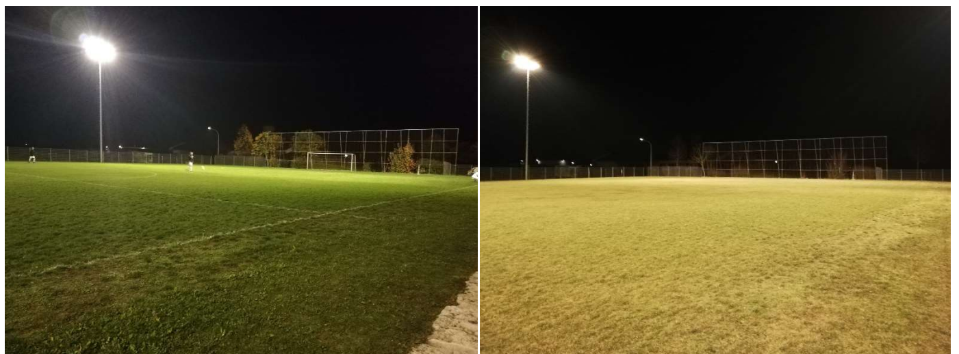
Blick von der Mittellinie – Südseite nach Osten

Deutlich gleichmäßigere Ausleuchtung bis zum Rand des Trainingsplatzes. Keine hell-dunkel Zonen. (Natürlich war der Rasen im Herbst deutlich grüner, als zum Zeitpunkt des Umbaus.)