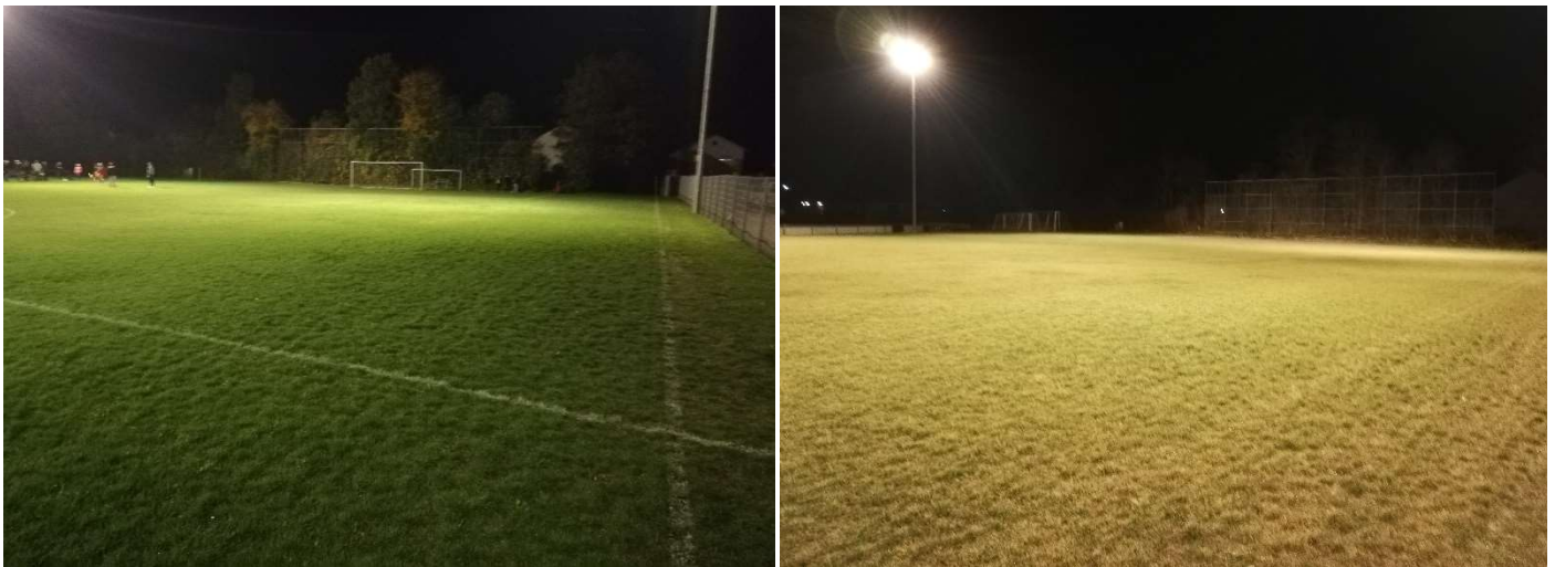
Blick von der Mittellinie – Nordseite nach Westen